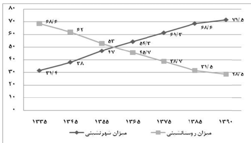
نمودار ۱. تحولات میزان‌های روستائینشی و شهرنشینی در ایران، ۱۳۳۵-۱۳۹۰