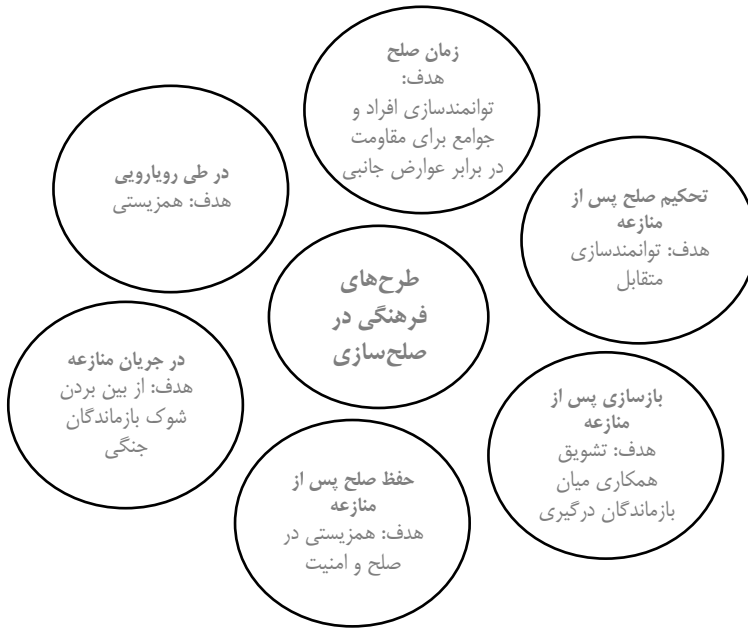
شکل ۱. طرح‌های فرهنگی در صلح‌سازی

در زمان صلح را نشان می‌دهد (شهرام‌نیا و نظیفی، ۱۳۹۲):